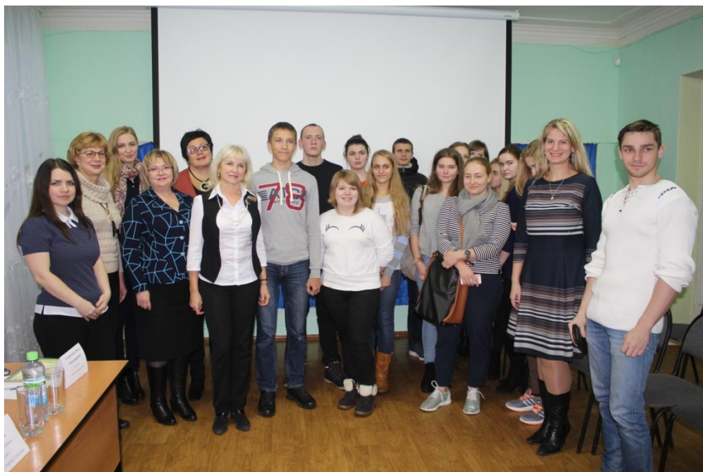
Праздничный вечер «Тепло материнских рук»