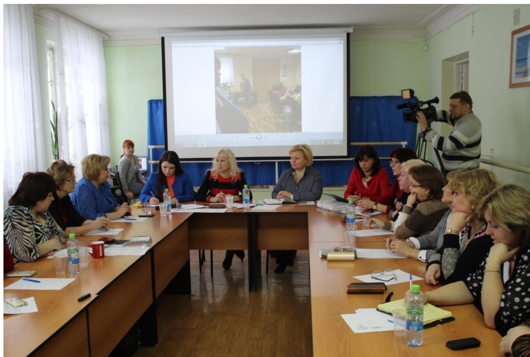
Городское профориентационное мероприятие

На мероприятии обсуждались вопросы трудовой адаптации детей-инвалидов и детей с ОВЗ, вопросы их профессионального обучения и трудоустройства. Главной темой мероприятия стала проблема профориентации особых детей. Присутствующие поделились своим опытом работы, в конце совещания были определены основные этапы профориентации детей-инвалидов и детей с ОВЗ. Также была отмечена необходимость обсуждения другой особо важной проблемы – проблемы трудоустройства инвалидов и лиц с ОВЗ, встреча с работодателями.